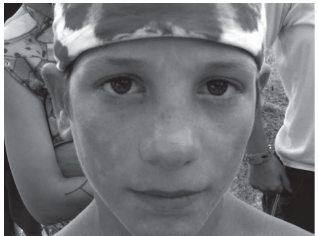
Fragende Augen in Rumänien

Filme „Die fetten Jahre sind vorbei“ sowie „Bruce Almighty“.