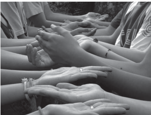
Ein Eindruck aus dem Reli-Projekt

In der jährlichen Filmnacht zeigten wir die beiden