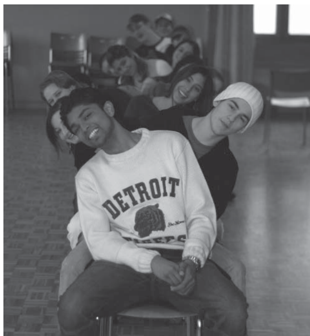
Im Rahmen der Präventionsarbeit: "Beziehungskiste" - ein Nachmittag mit Firmlingen

Ferner konnten mit dem Kenia-Projekt neue Kontakte mit Afrikanerinnen und Afrikanern, die in Basel leben, geknüpft werden, trotz der schwierigen Situation, dass HIV/Aids bei Afrikanern sehr stark tabuisiert wird. In den Gottesdiensten können die Menschen hautnah die Probleme Kenias spüren, erfahren aber auch die Problematik des Tabuisierens von HIV/Aids in der Schweiz und konkret wird Geld für ein Schulprojekt mit Aidsweisen in Kenia gesammelt.