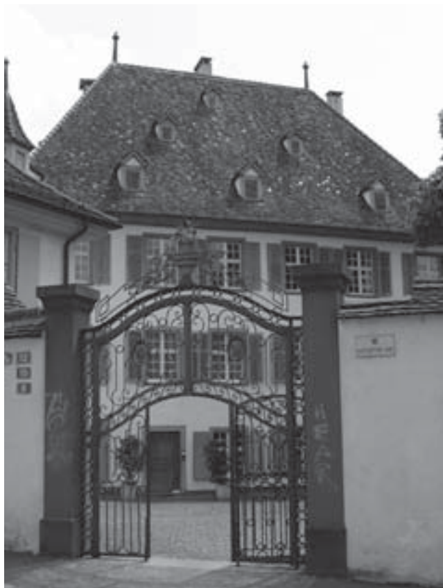
Hatstätterhof - Das neue ökumenische Zentrum für Religionsunterricht und Gemeindekatechese in Basel

Baustellen der Welt wohl üblichen und anscheinend unumgänglichen Verzögerungen waren das grosse und bleibende Ereignis! Vielmehr ist es die Erfahrung, erstmals in der Geschichte der „katechetischen Arbeitsstelle BL“ in einem grösseren Umfeld mit anderen Menschen zusammen zu arbeiten. Hatte die Fachstelle in den 80-er Jahren noch aus einem Büro in der Privatwohnung des Stellenleitenden bestanden, so haben wir heute in historischem Gemäuer einen Platz gefunden, wo Zusammenarbeit über Kantons- und Konfessionsgrenzen nicht die Ausnahme, sondern die Regel ist. Gemeinsam mit rund einem Dutzend Kolleginnen und Kollegen der ref. und kath. Kirchen beider Basel bemühen wir uns, wichtige religionspädagogische Anliegen unserer Zeit wahrzunehmen. „Ökumenisches Handeln ist für uns die Regel, nicht die Ausnahme“ heisst es im Pastoralen Entwicklungsplan des Bistums Basel. Bei uns ist das nicht mehr Papier, sondern in allen Bereichen, wo es irgendwie Sinn macht, bereits Wirklichkeit. So arbeiten wir v.a. in der Aus- und Fortbildung der religionspädagogisch Tätigen intensiv zusammen.